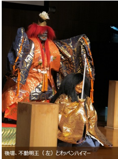
後場、不動明王(左)とオッペンハイマー

オッペンハイマーの亡霊は前場と後場で異なる能面を着けている。前場は絶望や憔悴を表す「俊寛(しゅんかん)」の面、後場は激しくもどこか悲しみを感じさせる同作オリジナルの面で、日本の能面師・北澤秀太氏の手による作品だ。公演に先駆けてシドニーのジャパンファウンデーションでは同氏の手による能面の展示会も催され、小面(こおもて)や般若(はんや)などの伝統的な面から現代的な作品までが並んだ。