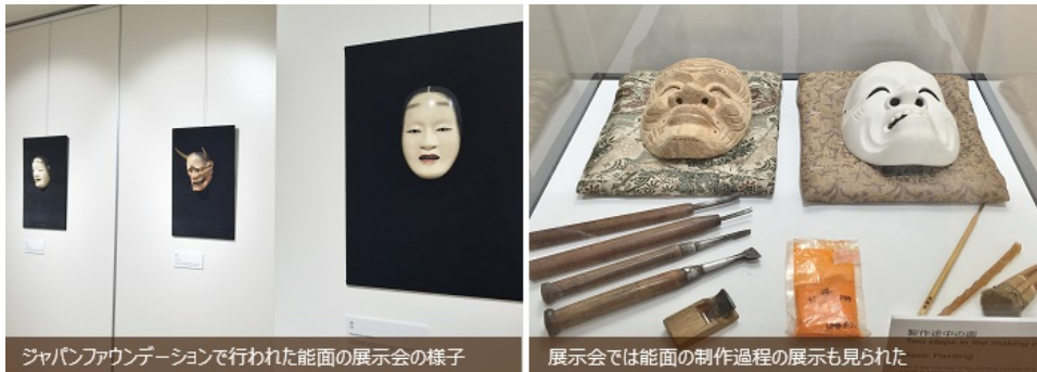
ジャパンファウンデーションで行われた能面の展示会の様子