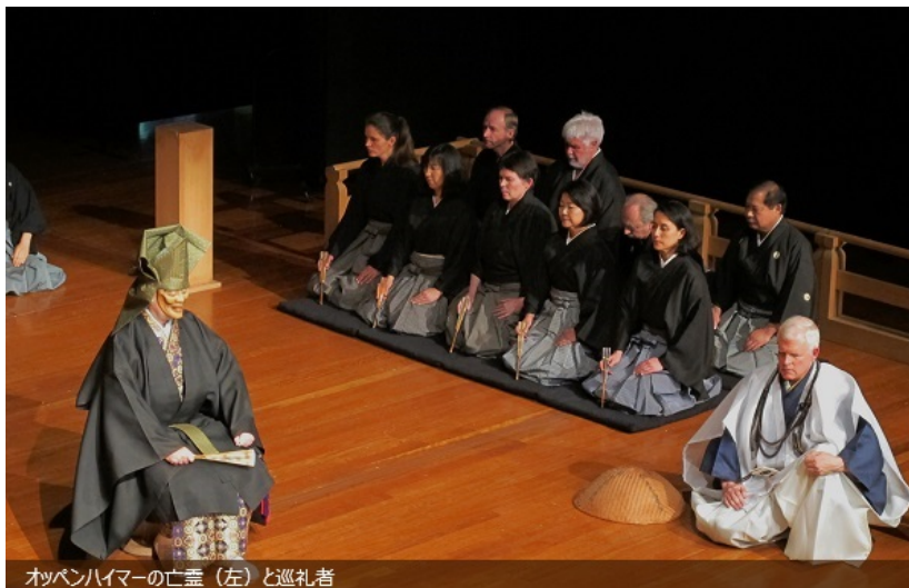
オッペンハイマーの亡霊(左)と巡礼者

9月30日にThe Sydney Conservatorium of Musicで初演された『Oppenheimer (オッペンハイマー)』は、シドニー大学で音楽学の教鞭を執っていたアラン・マレット氏により書き下ろされた英語による能作品。戦後70年の節目である2015年にふさわしく「ヒロシマ」に投下された原子爆弾を作ったロバート・オッペンハイマーをテーマとした、哲学的・禅的な側面を多分に持つ観ごたえのある物語だ。